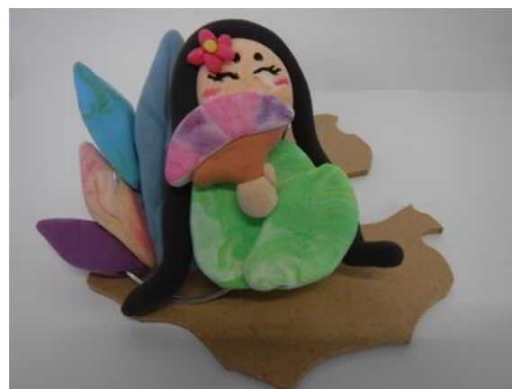
150周年キャラクター「ツシー」