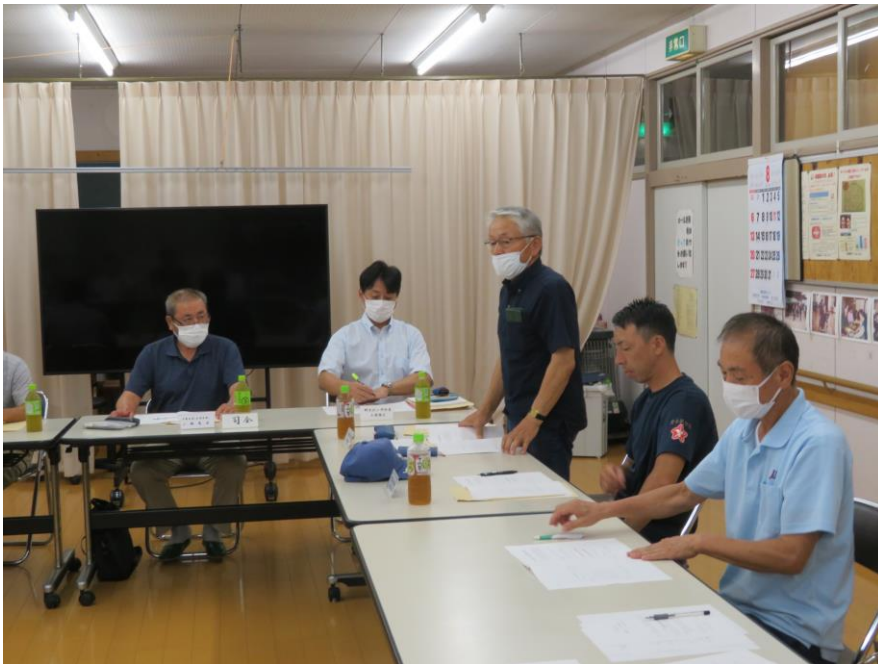
鼓笛パレード団体長会議