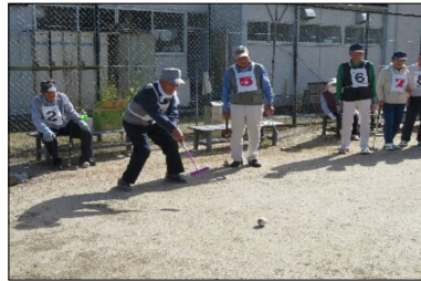
ゲートボール風景

総勢20名が参加され、秋晴れの汗ばむ気温の中、プレーにも熱が入り熱戦が繰り広げられた。 【結果は次の通り】 ☆優勝 中野Aチーム ☆準優勝 塩沢Aチーム