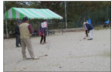
グランドゴルフ風景