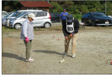
ゲートボール風景

総勢20名が参加され、秋晴れの汗ばむ気温の中、プレーにも熱が入り熱戦が繰り広げられた。 【結果は次の通り】 ☆優勝 中野Aチーム ☆準優勝 塩沢Aチーム